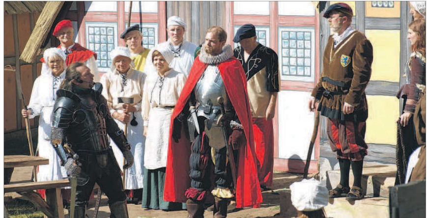
Ritter, Topf und Deckel – so hieß die Aufführung mit der die Schauspieler bei drei Aufführungen die Zuschauer begeisterten.