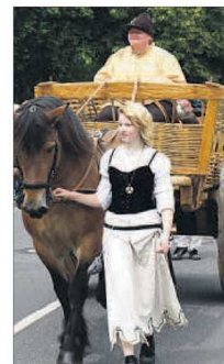
Mit dem Pferdewagen zurück ins Mittelalter.