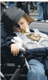
So ein langer Weg fordert auch vom tapfersten Ritter Tribut.