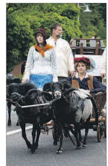
Manche haben es ganz bequem...