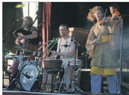
Cocolorus Diaboli heizt am Sonnabend mit mittelalterlichen Klängen dem Publikum im BöhmePark ein.