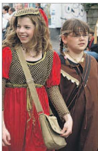
Mittelalterliche Gewänder sind beim Umzug Pflicht.