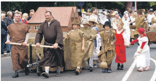
Seit Wochen bastelte die Dorfgemeinschaft Wolterdingen an ihrem Beitrag für den Umzug. Sie erhalten gestern viel Beifall von den vielen Zuschauern.