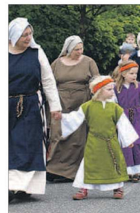
Auch die Kindergärten, Kindertagesstätten und Schulen Soltaus beteiligen sich am Festumzug.