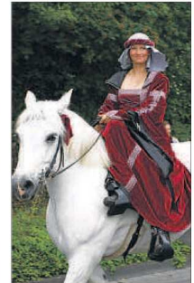
Hoch zu Ross geht es durch Soltau.