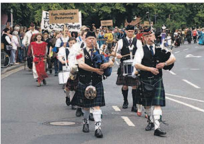
Rund 800 Menschen beteiligen sich an dem Festumzug durch Soltau – auch die Schotten sind dabei.