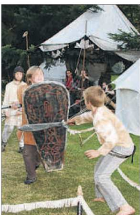
Für die Ritterausbildung müssen die Knappen viel leisten.