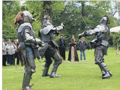
Ritterliche Kampfkunst zeigt die „Cocolorus“-Truppe auf dem Marktgelände im BöhmePark.