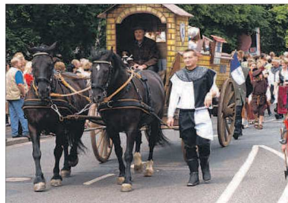
Viel Mühe machen sich die Beteiligten, um ihre Wagen dem Motto entsprechend auszustatten.