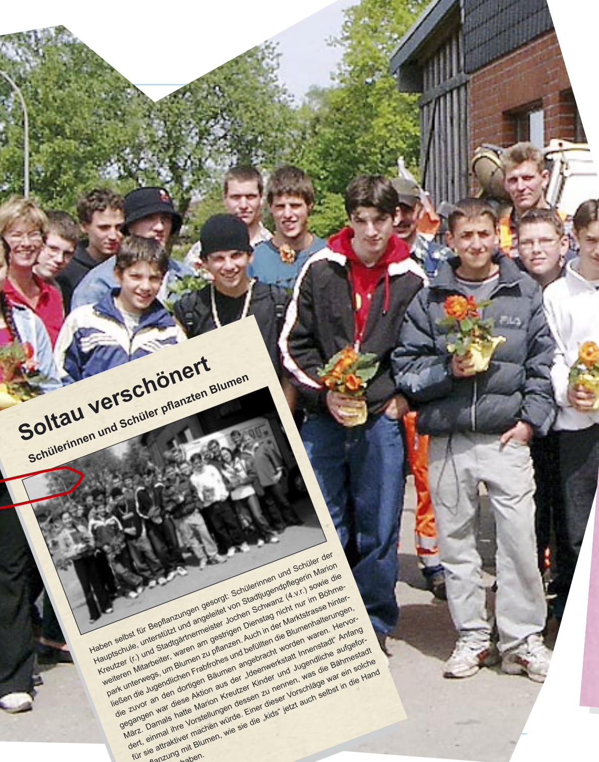
Soltau verschönert Schülerinnen und Schüler pflanzten Blumen