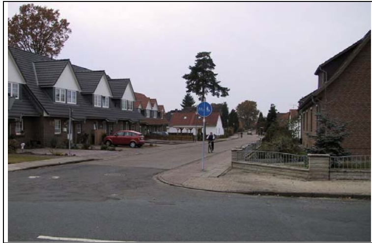
Bild 4: Derzeit noch benutzungspflichtiger Radweg in geplanter Tempo 30-Zone (Böningweg)