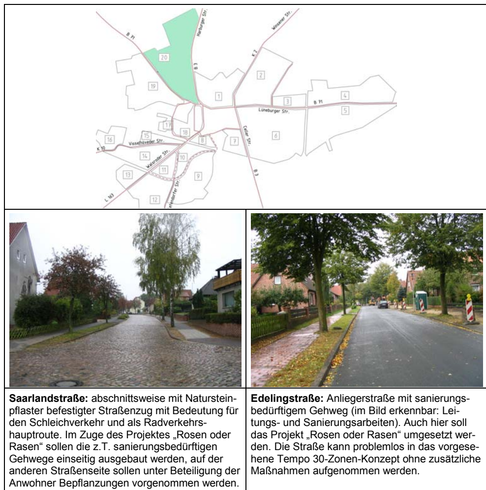
Zone 20 „Saarlandstraße“

Straße zu erreichen. Die Saarlandstraße hat in Verbindung mit dem weiteren Verlauf über die Paul-Gerhardt-Straße auch Bedeutung als Schleichverkehrsweg zwischen B 3 und B 71, was insbesondere in den Altpflasterabschnitten zu erheblichen Lärmbelastigungen führen kann. Das Altpflaster aus Naturstein ist in der Saarlandstraße zwischen Buchhopsweg und Carl-Peters-Straße sowie im gesamten Verlauf der Carl-Peters-Straße anzutreffen, was insbesondere für Radfahrer zu Qualitätseinbußen beim Befahren führt. Hervorzuheben sind in diesem Zusammenhang die im Radverkehrskonzept vorgesehenen Haupt- und Nebenrouten des Radverkehrs über Saarland-, Carl-Peters- und Paul-Gerhardt-Straße.