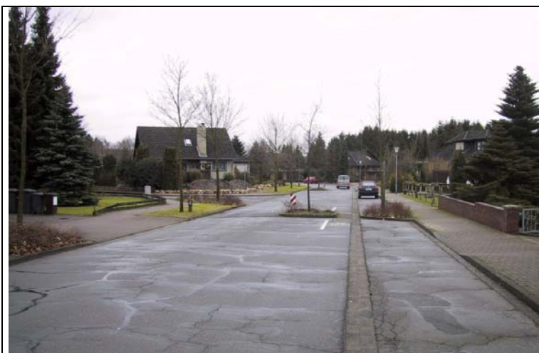
Bild 6: Verkehrsberuhigungsmaßnahme innerhalb einer Tempo 30-Zone und mittelfristig zu entsiegelnde Parkbuchten (Forellenweg)