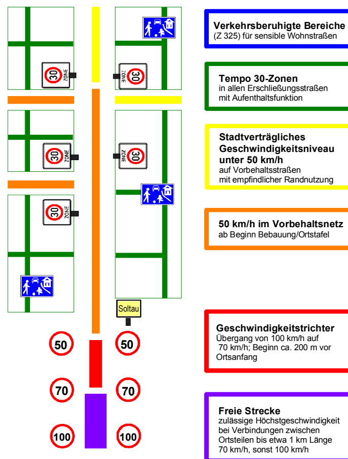
Bild 8: Zielkonzept Stadtvträgliches Geschwindigkeitsniveau in Soltau

Bild 8 zeigt, wie sich die Tempo 30-Zonen in ein Gesamtkonzept zur Erzielung eines verträglichen Geschwindigkeitsniveaus im gesamten Stadtgebiet integrieren lassen. Hierin sind auch die Straßen des Vorbehaltensnetzes eingebunden, für die ebenfalls von der freien Strecke kommend über Geschwindigkeitstrichter, ggf. durch Begleitmaßnahmen unterstützt, ein angepasstes Geschwindigkeitsniveau im bebauten Bereich anzustreben ist. Sinnvolle Begleitmaßnahmen können z.B. Mittelinseln darstellen, die den Übergang zum bebauten Tempo 50-Bereich verdeutlichen und gleichzeitig oft eine sinnvolle Funktion als Querungshilfe am Ortseingang (Übergang von einseitigen Geh- und Radwegen außerorts) darstellen (vgl. auch Radverkehrskonzept). In den Wohnbereichen selbst kommt dann die flächenhafte Tempo 30-Regelung, verstärkt durch einzelne verkehrsberuhigte Bereiche (Z 325) in Frage.