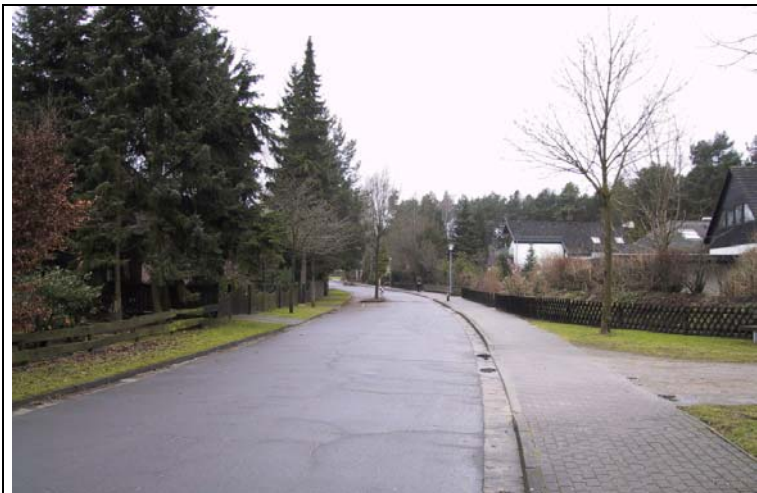
Bild 5: Straße mit einseitigem Gehweg und einseitigem Grünstreifen (Forellenweg); Umsetzung in Tempo 30-Zonen gemäß Projekt „Rosen oder Rasen“