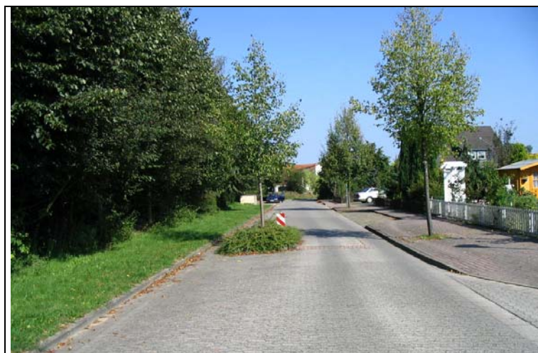
Bild 3: (ältere) Plateaufpflasterung zur Geschwindigkeitsdämpfung (Lakenmacherstraße) (neue Aufpflasterungen im Streckenverlauf sollten ohne Bepflanzung umgesetzt werden, da Radfahrer- und wartungsfreundlicher)